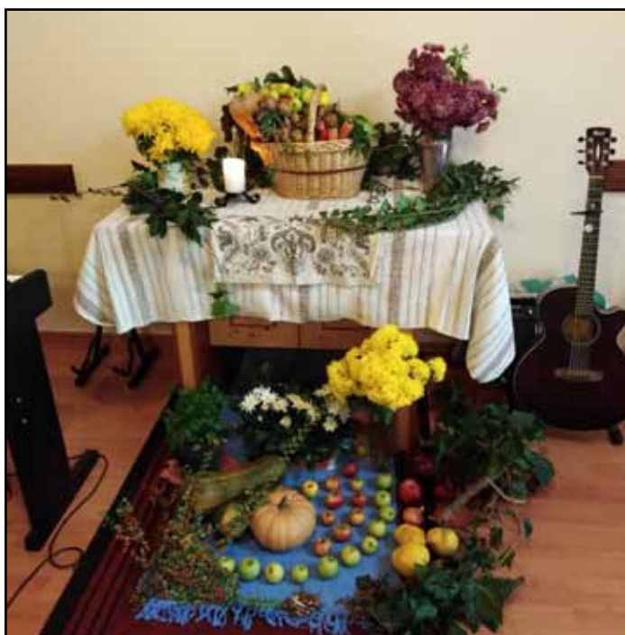
A díszítést készítette Rab Fanni