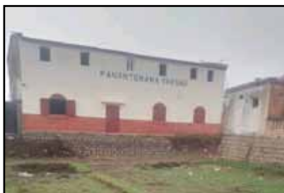
Bepillantás a madagaszkári szegény- és árvagyerekekről gondoskodó metodista központ életébe